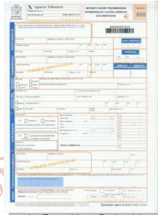
Impuesto sobre Transmisiones Patrimoniales y Actos Jurídicos documentados