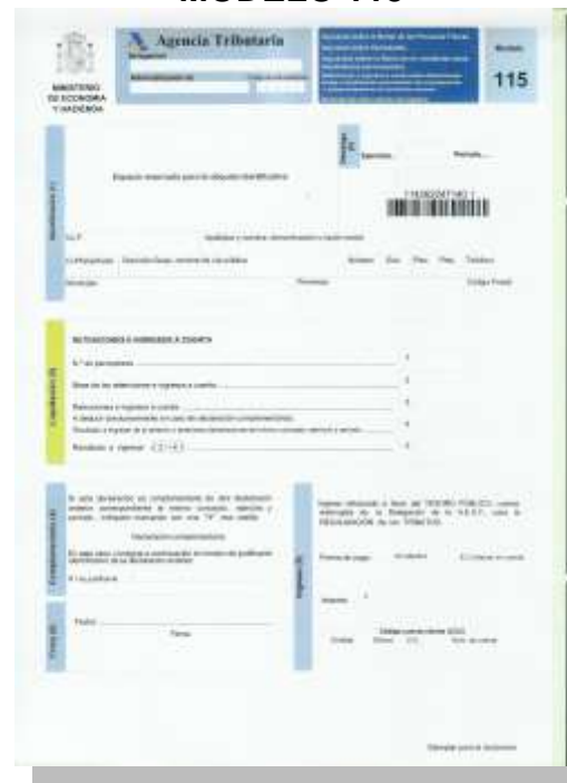
Retenciones e ingresos a cuenta. Rentas o rendimientos procedentes del arrendamiento o subarrendamiento de inmuebles urbanos.