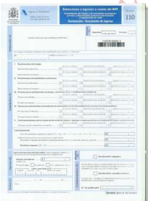
Retenciones e ingresos a cuenta. Rendimientos del trabajo, de actividades profesionales, de actividades agrícolas y ganaderas y premios.