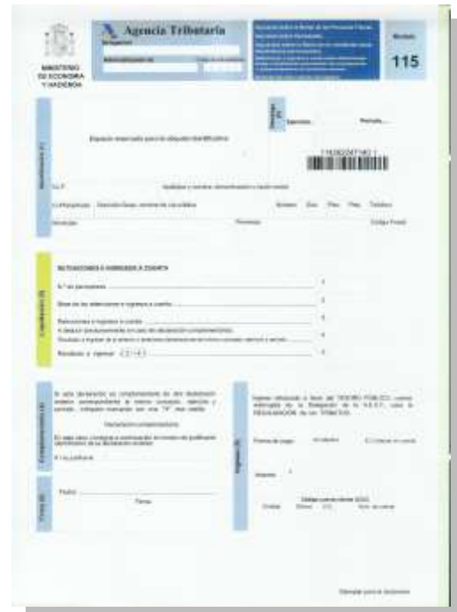
Retenciones e ingresos a cuenta. Rentas o rendimientos procedentes del arrendamiento o subarrendamiento de inmuebles urbanos.