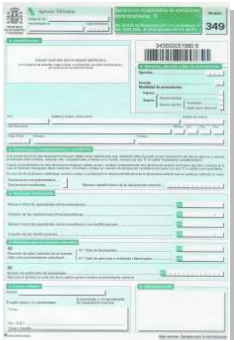
Declaración recapitulativa de operaciones intracomunitarias