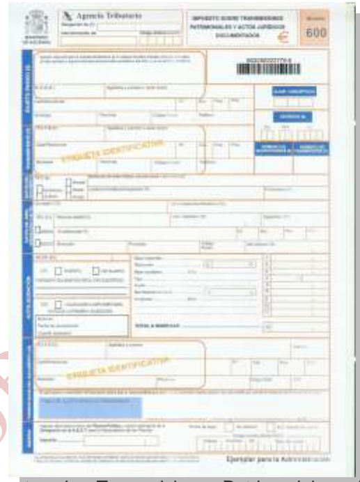
Impuesto sobre Transmisiones Patrimoniales y Actos Jurídicos documentados